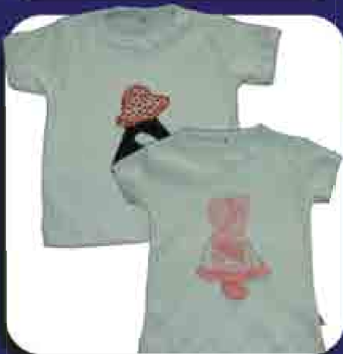
1 Camiseta Patchwork Cod.: 224090