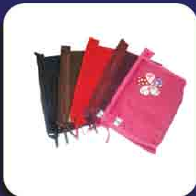
1 Bolsa Mari Cod.: 224478