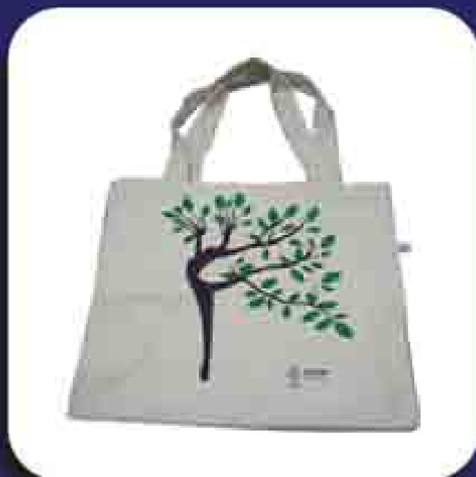
1 Bolsa Nozinho Cod.: 001471