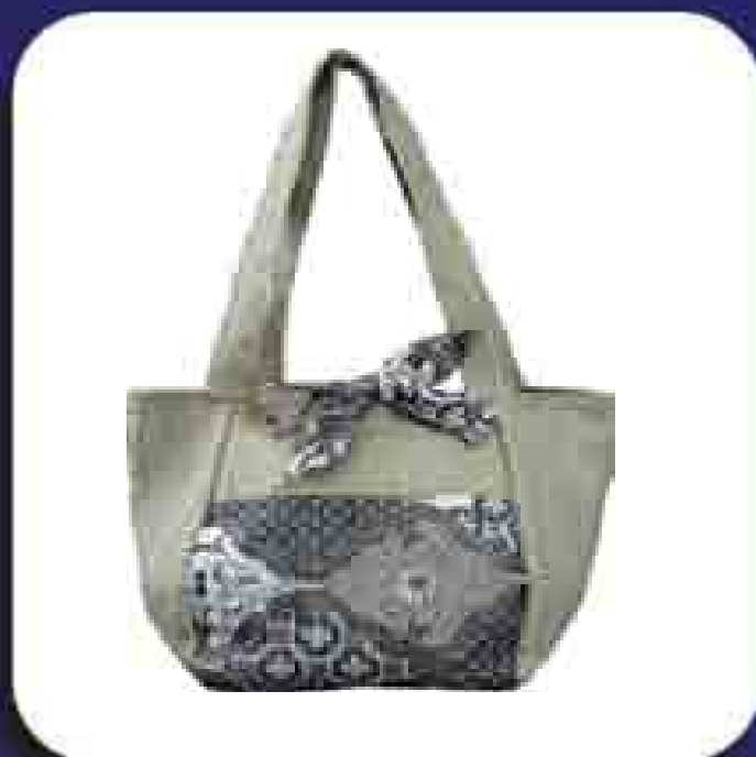
1 Bolsa Chris Cod.: 223987